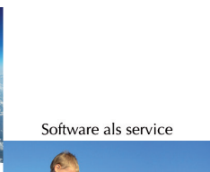
Software als service