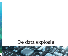
De data explosie